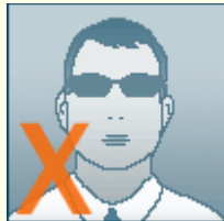
بدون عینک باشد