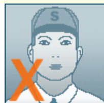
با کلاه و لباس فرم و یا محلی نباشد